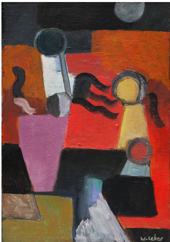
Tischfeuerwerk, 2008, Öl/Sperrholz, 40x29cm, 1.200 €