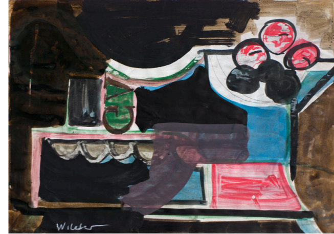
Stilleben mit Früchten, 1996, Aquarell, 29,5x42cm, 600 €