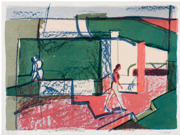
Vor der Kaufhalle, 1980, Farbzinkografie, 28x38, 140 €