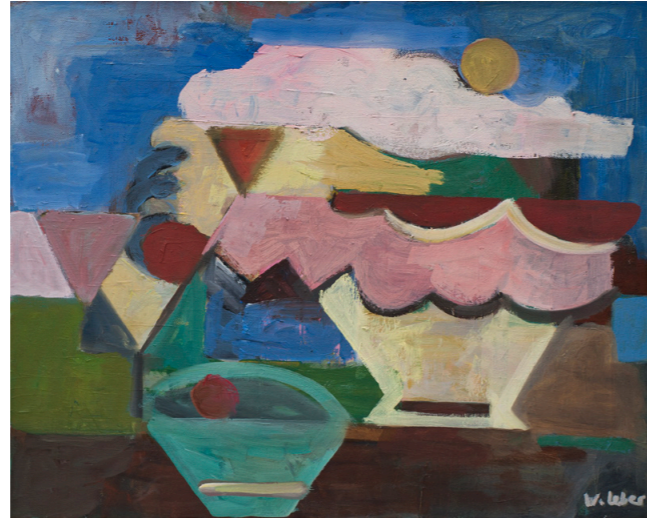
Stilleben mit rosa Wolke, 2006, Öl/Lw, 40x50cm, 1.600 €