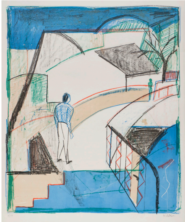
Kleine Brücke, 1981, Farbzinkografie, 52x43cm, 400 €