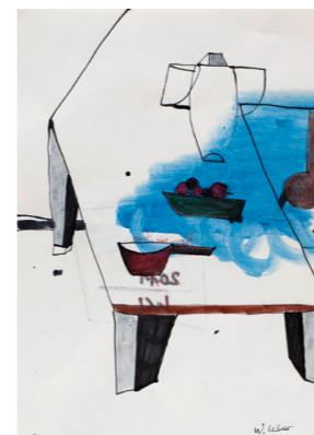
Brombeeren, 2011, Aquarell, 29,5x21cm, 400 €