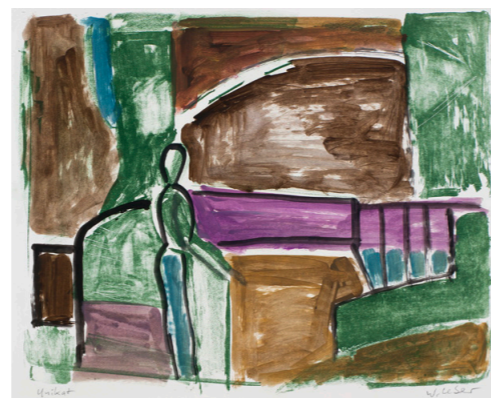
Stadtmotiv, 1979, übermalte Lithografie/Unikat, 31x40cm, 420 €