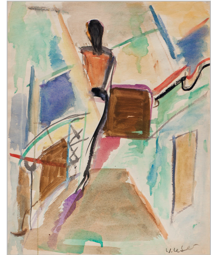
Figur in einem Lichtkegel, 1985, Aquarell, 51x41cm, 800 €