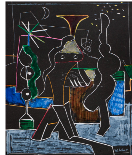
Die drei, 2014, übermalte Lithografie, 24x21cm, 200 €

Alle Werke werden mit 60% des angegebenen Galeriepreises aufgerufen.