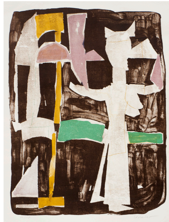
Kleine Fee, 2000, Farblithografie, 38x29cm, 300 €