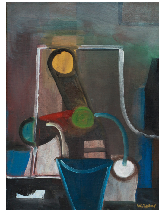
Wunderblume, 2012, Öl/Lw, 40x30cm, 1.200 €