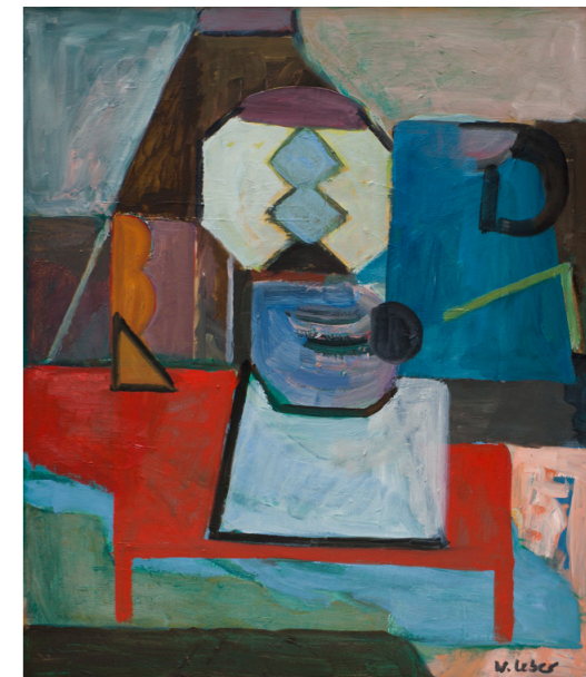
Laternenstunde, 2007, Öl/Malpappe, 53x45, 1.800 €